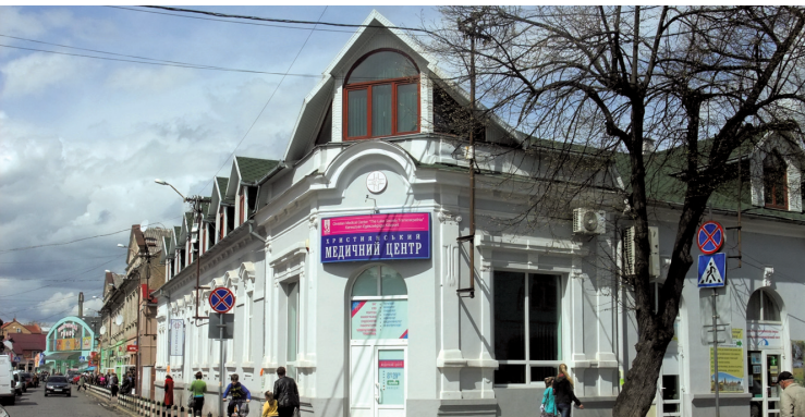
Christian Medical Center, Mukachevo (Munkacs)