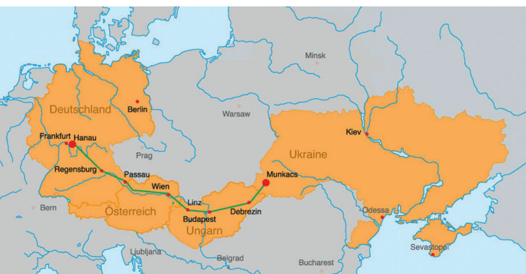
1340 km von Hanau nach Munkacs